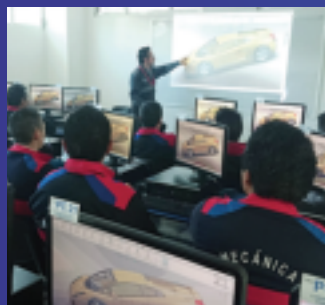
✓ DISEÑO AUTOMOTRÍZ

Nuestro Modelo Educativo ISIMA PROJECT 21, permite a nuestros estudiantes realizar prácticas reales, con el respaldo de profesores altamente calificados, de esta manera saldrás totalmente capacitado para incursionar en el campo laboral en alguna empresa privada o institución pública.