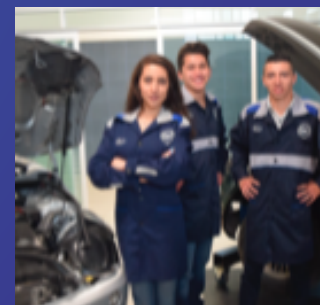
✓ LAB. DE DIAGNÓSTICO