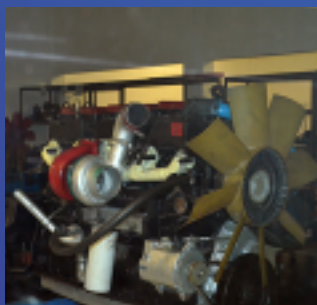
✓ LAB. DIESEL