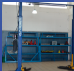
✓ LAB. PRÁCTICA LIBRE