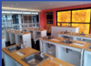
✓ Lab. de enología