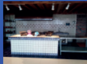
✓ Cocina Mexicana