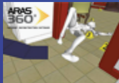
✓ Simulador virtual de actos delictivos