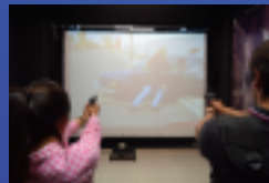
✓ Stand de tiro virtual