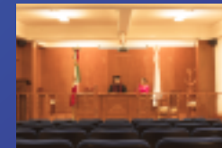
✓ Sala de Juicios Orales