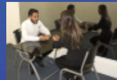
✓ Cámara de Gesell