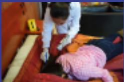
✓ Recreación de hechos

Nuestro Modelo Educativo ISIMA PROJECT 21, permite a nuestros estudiantes realizar prácticas reales, con el respaldo de profesores altamente calificados, de esta manera saldrás totalmente capacitado para incursionar en el campo laboral en alguna empresa privada o institución pública.