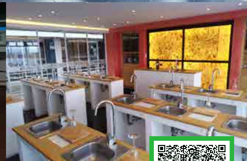
*Imágenes ilustrativas correspondientes a diversos planteles de Grupo ISIMA.

Av. Héroes de La Independencia No. 532, Col. Guadalupe Hidalgo, C.P. 75790, Tehuacán, Puebla.