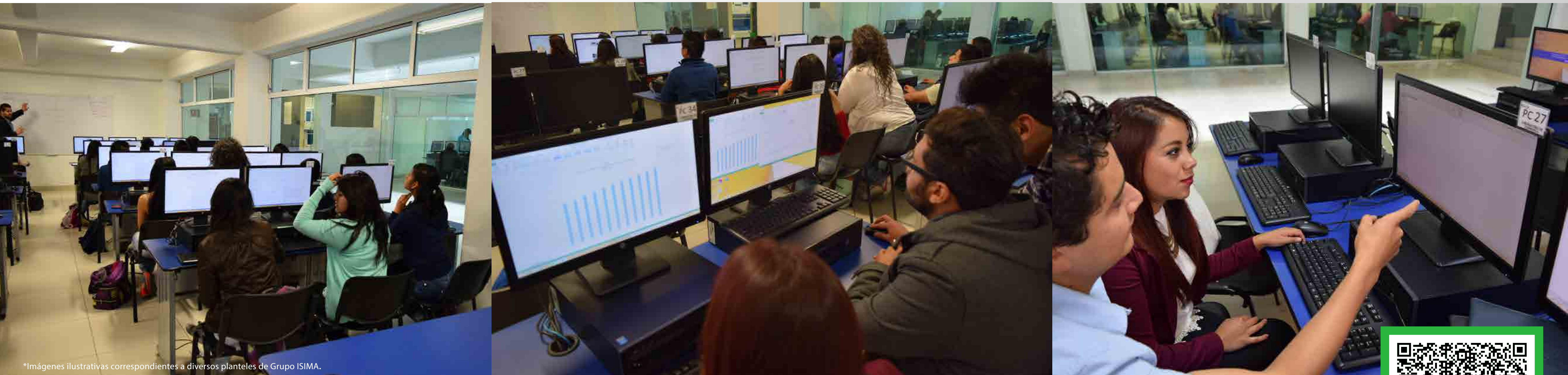
*Imágenes ilustrativas correspondientes a diversos planteles de Grupo ISIMA.

📍 Circuito Moisés Solana No. 503, Col. Vista Alegre, C.P. 76090, Querétaro, Querétaro ✉ queretaro@isima.com.mx ☎ (442)161 2860 (442)182 0660 (442)182 0661