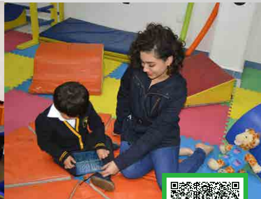
*Imágenes ilustrativas correspondientes a diversos planteles de Grupo ISIMA.

📍 Circuito Moisés Solana No. 503, Col. Vista Alegre, C.P. 76090, Querétaro, Querétaro