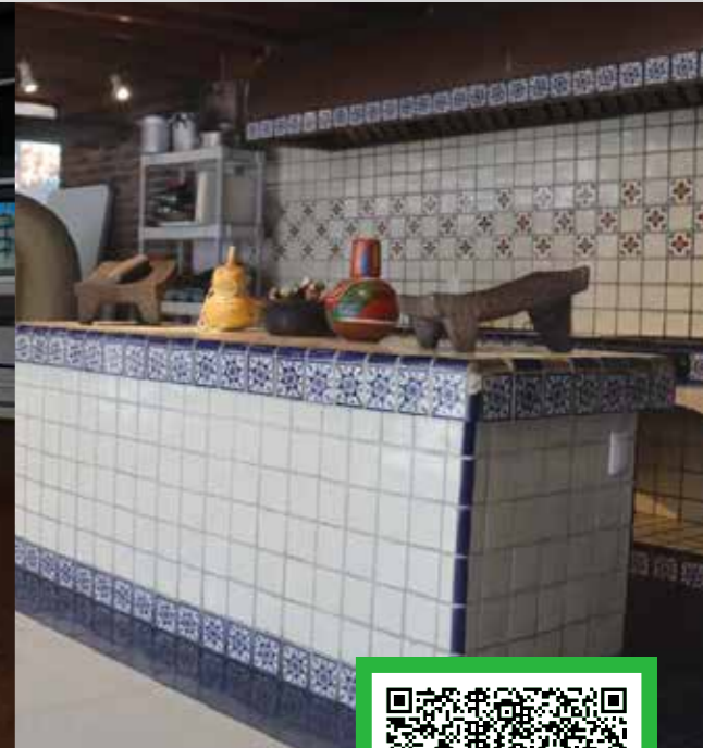
*Imágenes ilustrativas correspondientes a diversos planteles de Grupo ISIMA.

Av. Benito Juárez No. 920, Esq. Ignacio Aldama, Col. Centro, C.P. 96400 Coatzacoalcos, Veracruz.