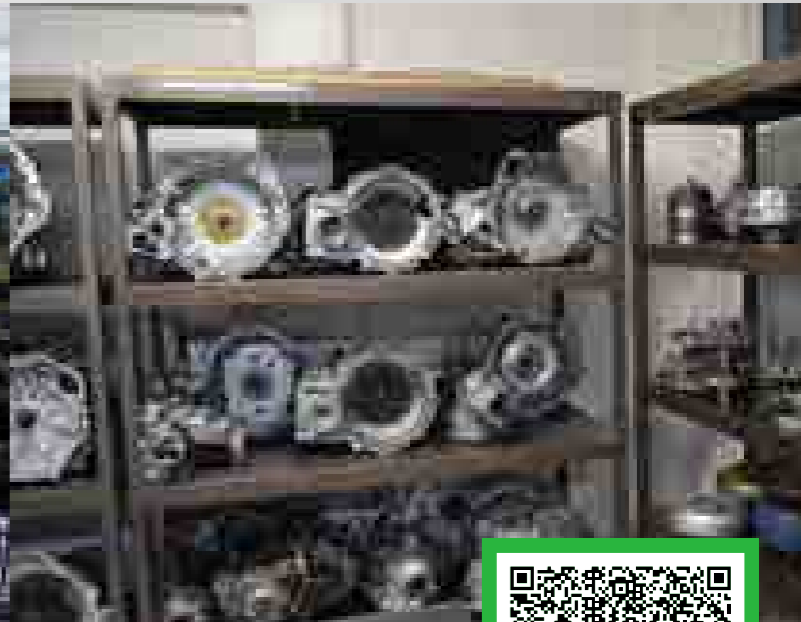
*Imágenes ilustrativas correspondientes a diversos planteles de Grupo ISIMA.

📍 Pino Suárez Sur No. 314, Col. 5 de Mayo, C.P. 50090, Toluca de Lerdo, México.