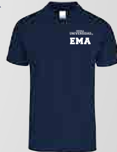
Color: Azul Marino