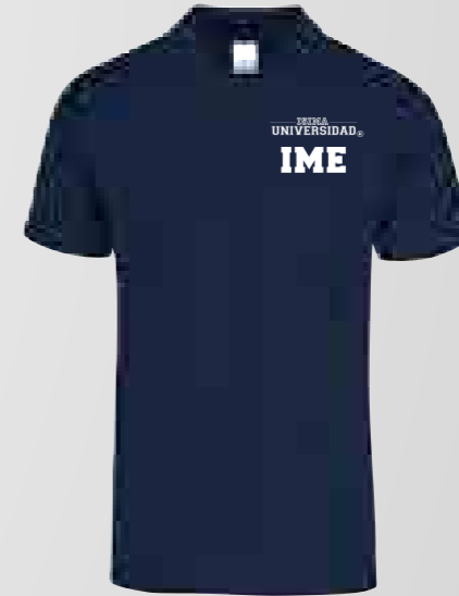
Color: Azul Marino