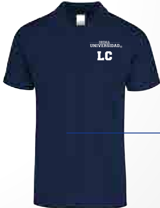
Color: Azul Marino