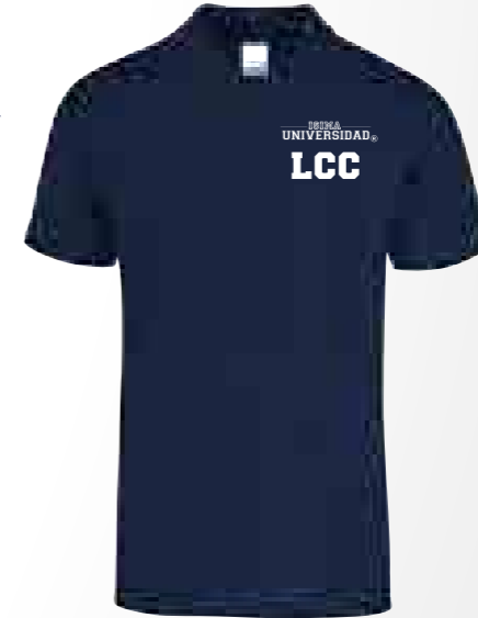
Color: Azul Marino