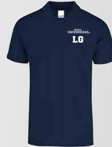
Color: Azul Marino