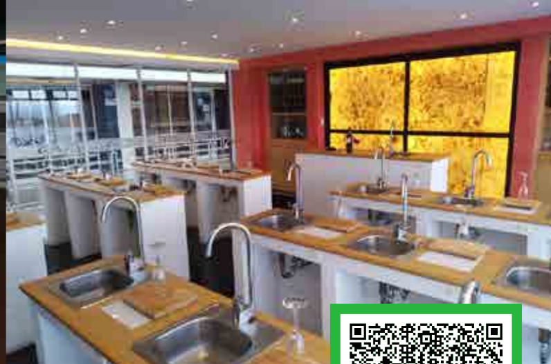
*Imágenes ilustrativas correspondientes a diversos planteles de Grupo ISIMA.

Av Francisco I. Madero Ote 657, Centro histórico de Morelia, 58000 Morelia, Mich.