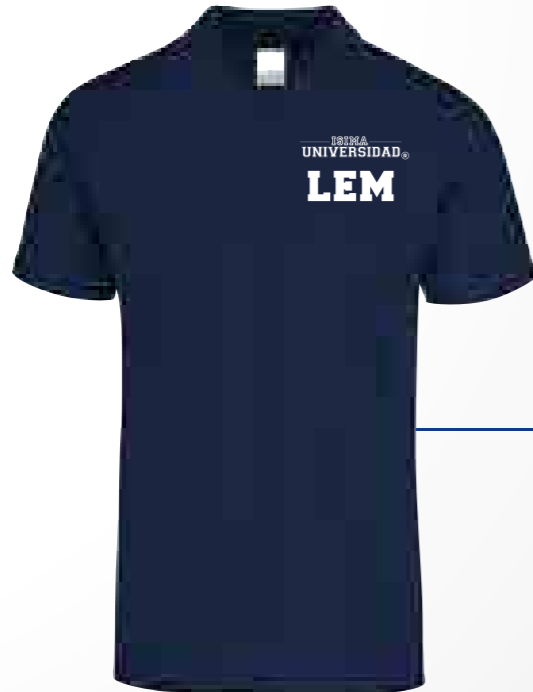
Color: Azul Marino