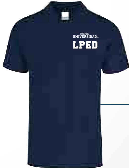
Color: Azul Marino