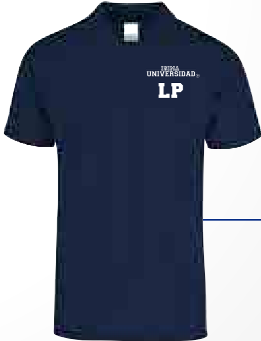
Color: Azul Marino