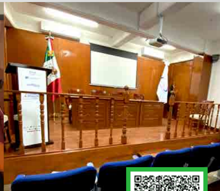
*Imágenes ilustrativas correspondientes a diversos planteles de Grupo ISIMA

📍 Circuito Moisés Solana No. 503, Col. Vista Alegre, C.P. 76090, Querétaro, Querétaro