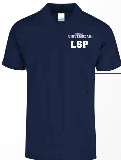
Color: Azul Marino