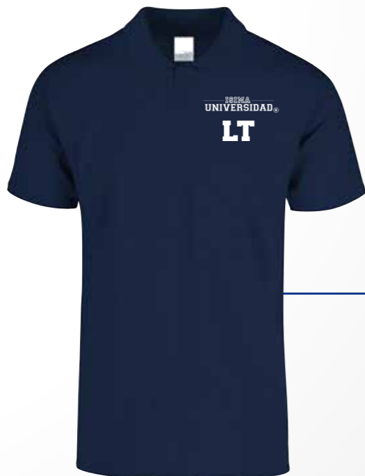
Color: Azul Marino