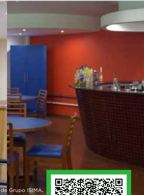
*Imágenes ilustrativas correspondientes a diversos planteles de Grupo ISIMA.

📍 Pino Suárez Sur No. 314, Col. 5 de Mayo, C.P. 50090, Toluca de Lerdo, México.