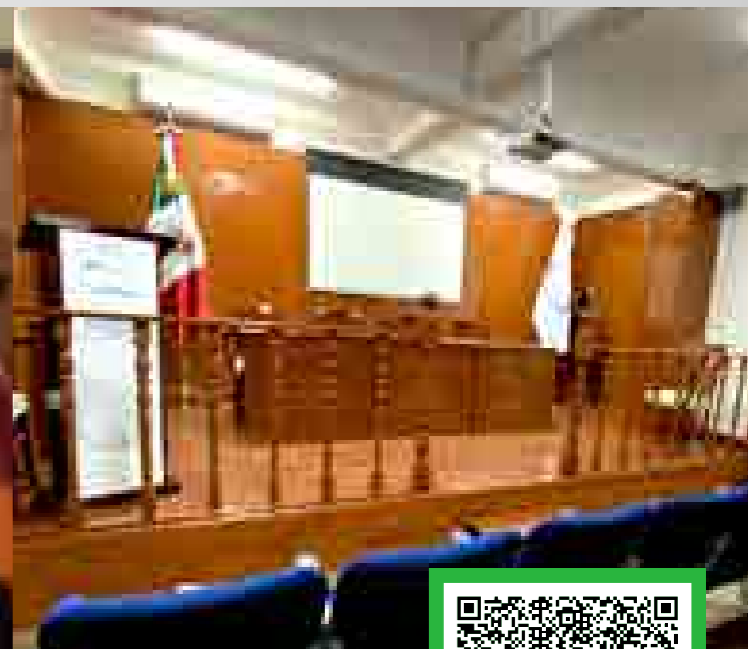
*Imágenes ilustrativas correspondientes a diversos planteles de Grupo ISIMA.

📍 Pino Suárez Sur No. 314, Col. 5 de Mayo, C.P. 50090, Toluca de Lerdo, México.